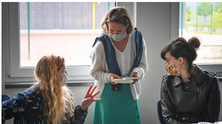
Een taal leren spreken kan prima in kleinere groepjes, om zo elke leerling meer aan het woord te laten komen.

De Taalunie gaat samen met scholen en organisaties in elk buurland actie ondernemen om de lerare(sse)n