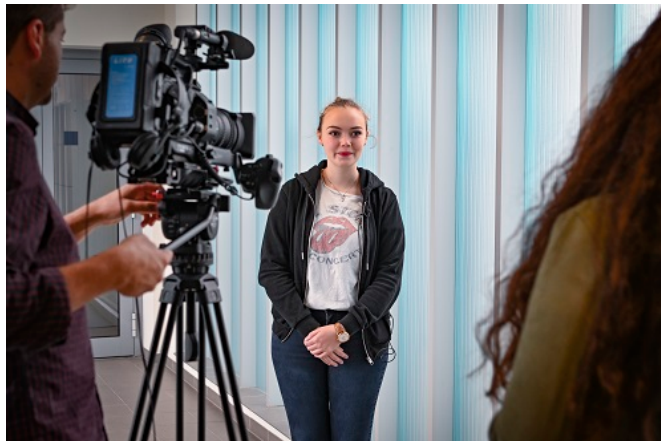
De Taalunie vindt het belangrijk om te weten wat de leerlingen van het onderwijs Nederlands vinden: hun mening telt.

Bijna 3.000 van de in totaal bijna 170.000 jongeren die Nederlands leren in Noord-Frankrijk, Wallonië, Brussel, Noordrijn-Westfalen, Nedersaksen en Oost-België gaven antwoord op de vraag: wat vind je van de lessen Nederlands? Ze mochten vertellen wat ze vinden van hun docent, van Nederland en Vlaanderen, en van de Nederlandse taal. De Taalunie wilde dat weten om de leraren en leraressen Nederlands beter te kunnen helpen om hun lessen zo goed mogelijk te geven.